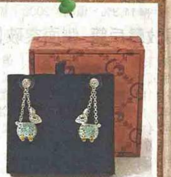
消費禮品(節日禮品)金獎 產品名稱: 925 Silver Mid-Autumn Lantern Jewelry Collection

公司名稱: 香港猿創 產品介紹: 以香港傳統中秋節常見的兔子、楊桃，設計出吊墜、耳環及胸針等，內有夜光石