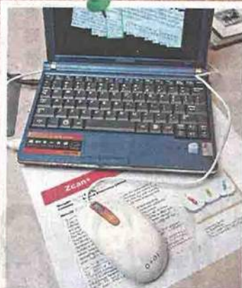
消費禮品(工作間) 金獎及評審團大獎

產品名稱: Zcan+ 公司名稱: Systech Electronics Limited